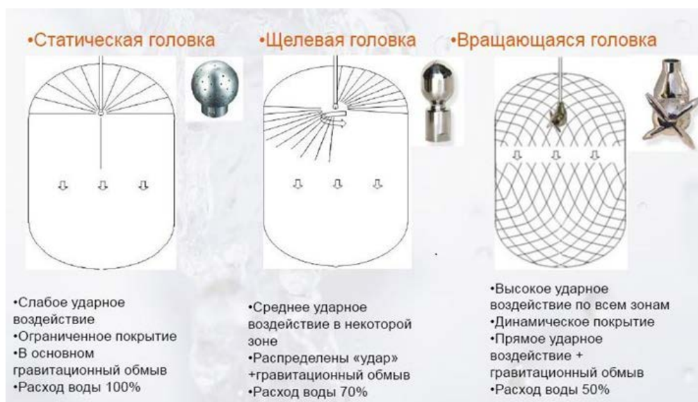
Рисунок 2 – Основные типы моющих головок

Такая конструкция особенно эффективна и позволит избежать появления застойных зон и необработанных участков при санитарной обработке больших емкостей.