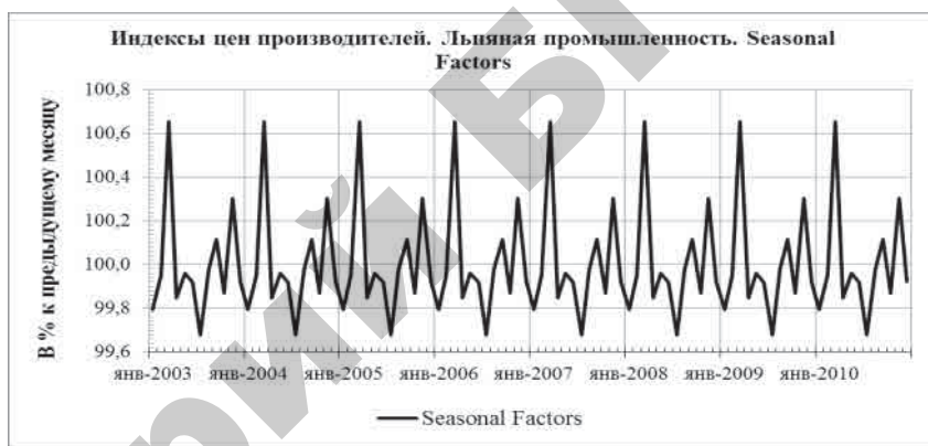
Рисунок 2. Сезонная составляющая временного ряда уровней индексов цен производителей товаров льняной промышленности РБ