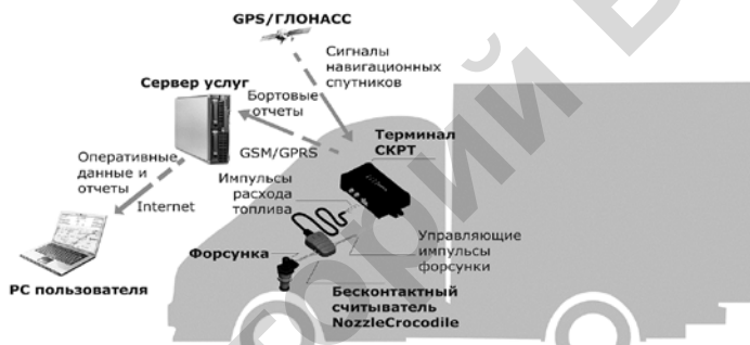
Рис. 3 – Метод считывания и передачи информации о расходе топлива и режимах работы ТС с бензиновыми и газовыми двигателями по импульсам форсунки.

Зачастую информация со штатного датчика уровня топлива (использующего принцип поплавка, с погрешностью измерения 7-10%) не устраивает по точности. В этом случае вместо штатного (либо дополнительно к нему) устанавливается емкостной датчик уровня топлива (DUT-E) с погрешностью менее 1%. На тракторы, погрузчики, экскаваторы и другую технику, которая работает на пересеченной местности либо с резко изменяющейся нагрузкой, устанавливается датчик-расходомер топлива DFM со встроенным счетчиком моточасов или система в комплекте с датчиком-расходомером топлива [2, 3].