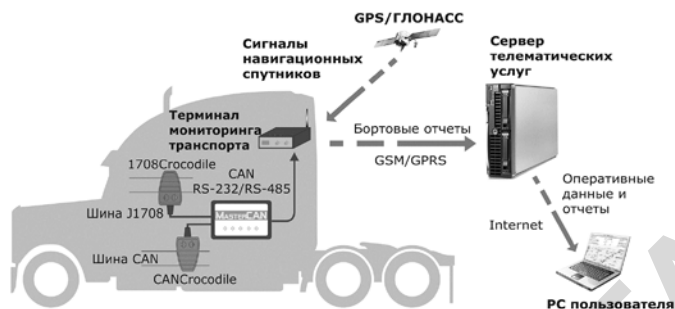
Рис. 2 – Метод считывания и передачи информации о расходе топлива и режимах работы ТС из шины CAN в режиме On-Line с использованием бесконтактного считывателя CANCroccodile и шлюза MasterCAN