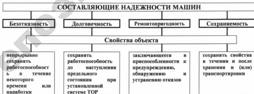
Рисунок 1. – Составляющие надежности машин

Надежность любых технических устройств и их элементов обуславливается, главным образом, безотказностью и ремонтпригодностью составных их элементов в заданных объемах функционирования (рисунок 1).