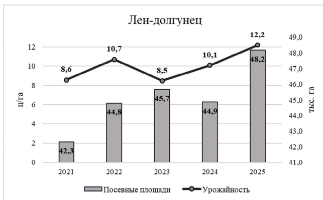
Рисунок 1. Динамика посевных площадей и урожайности льна-долгунца в Республике Беларусь, 2021-2025 гг.

Урожайность льноволокна за этот же период составила от 8,5 ц/га в 2023 г. до 12,2 ц/га в 2025 г.