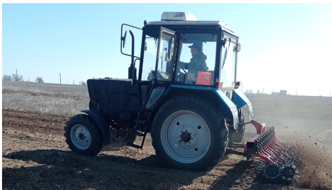
Рисунок 2 – Экспериментальный агрегат МТЗ-82.1 с боронной мотыгой БМТ-2,4 при обработке парового поля под посев прутняка