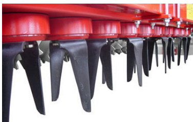
б) с вертикальной осью