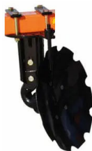
б) диск с вырезами