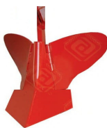
б) «Agromaster» (Турция)