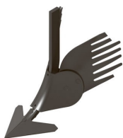
а) КОН-2,8 (Беларусь)

вода мощности их можно разделить на пассивные и активные. Пассивные – на тянущиеся и вращающиеся за счет реактивной силы при контакте с почвой (реактивные). Пассивные тянущиеся рабочие органы для образования гряд и гребней (рисунок 1), как правило, выполнены в виде лемешно-отвальных корпусов – стрелчатых лап, включающих в себя стойку, лемех и два отвала. Часть стрелчатых лап имеет возможность регулировки высоты гряды или гребня и ширины междурядий с учетом расстояния между грядками или гребнями. Большинство из них устанавливаются на жестких или подпружиненных стойках.