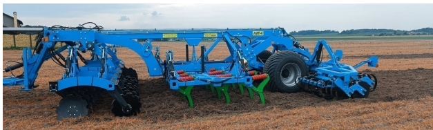
Рисунок 1 – Агрегат АМП-6

В соответствии с вышесказанным, а также для повышения производительности машино-тракторного агрегата при осуществлении основной безотвальной обработки почвы и загрузки тракторов мощностью 400 и более л.с. РУП «НПЦ НАН Беларуси по механизации сельского хозяйства» совместно с ООО «Биоком Технологии» разработан и изготовлен опытный образец агрегата почвообрабатывающего модульного АМП-6 (рисунок 1). Для обработки почвы на глубину от 27 до 40 см агрегат имеет рабочую ширину захвата 4 метра, для обработки почвы на глубину 12–27 см – 6 м, а для обработки почвы на глубину от 6 до 12 см – 8 метров.