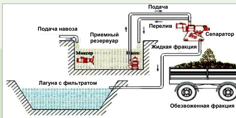
Рисунок 2 – Схема сепарации навоза

Применение технологии переработки навоза способом сепарирования (рисунок 2) позволяет решить ряд проблем на фермах и комплексах, в частности сокращение объемов навоза, а также уменьшение выделения неприятных запахов и парниковых газов в атмосферу.