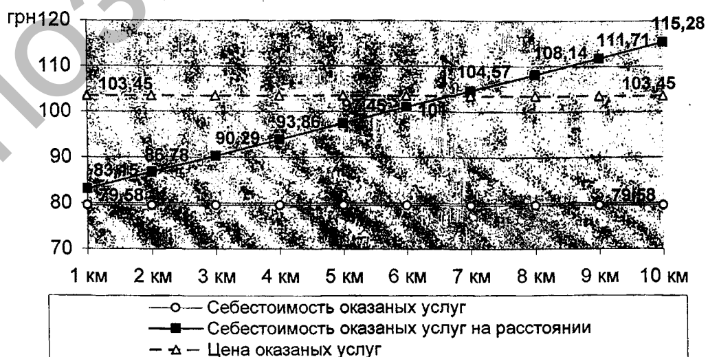
Рисунок 1 — Определение критического расстояния, при котором предоставление механизированных услуг будет безубыточным

Для определения критического расстояния, на которое может предоставлять механизированные услуги кооператив, используем графическо-математический метод (рисунок 1).