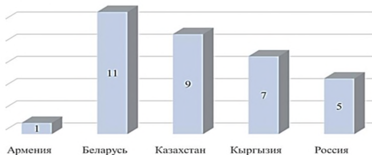
Рисунок 1. Количество обязательных видов страхования стран Евразийского экономического союза на 01.01.2021, % Примечание. Составлен автором на основе данных источника [11]

К специфическим нормативно-правовым актам,