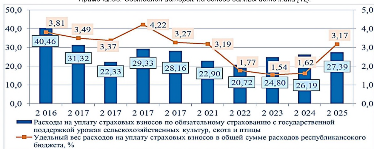
Рисунок 3. Финансирование части страховых взносов по обязательному страхованию с государственной поддержкой урожая сельскохозяйственных культур, скота и птицы за счет средств республиканского бюджета, млн руб

Примечание. Составлен автором на основе данных Государственной программы «Аграрный бизнес» на 2021-2025 гг.