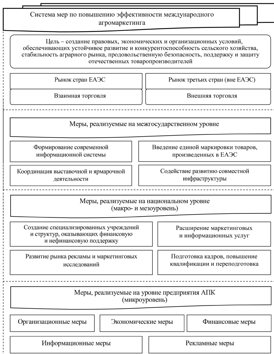
Рис. 2. Система мер по повышению эффективности международного маркетинга в АПК Беларуси в условиях интеграционных процессов (выполнен авторами на основе собственных исследований)

критериям (продуктовый, региональный, рыночный и др.); активизация работы торговых представительств государств-членов в части активного продвижения сельскохозяйственной продукции и продовольствия ЕАЭС на внешние рынки.