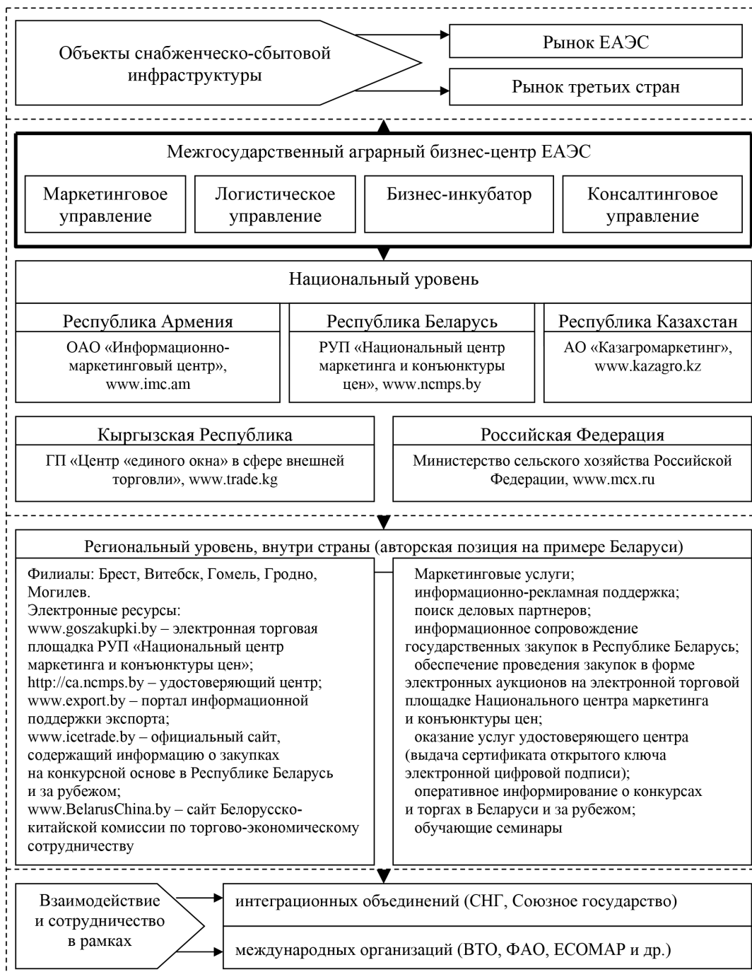
Рис. 2. Организационная структура и направления сотрудничества межгосударственного аграрного бизнес-центра ЕАЭС (выполнен автором на основании собственных исследований)

обеспечение всем поставщикам и потребителям сельскохозяйственной продукции, сырья и продовольствия равных возможностей для выхода на рынок, содействие развитию кооперационных связей между аграрными предприятиями ЕАЭС.