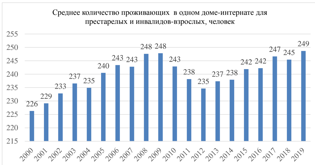
Рис.4. Среднее число проживающих в домах-интернатах для престарелых и инвалидов-взрослых в одном доме-интернате (человек) [1]

За анализируемый период рост числа проживающих в домах-интернатах для престарелых и инвалидов-взрослых составил 25,6%. Увеличение числа домов для инвалидов и престарелых, рост численности их жителей сопровождаются ростом среднего числа проживающих в них (рисунок 4).