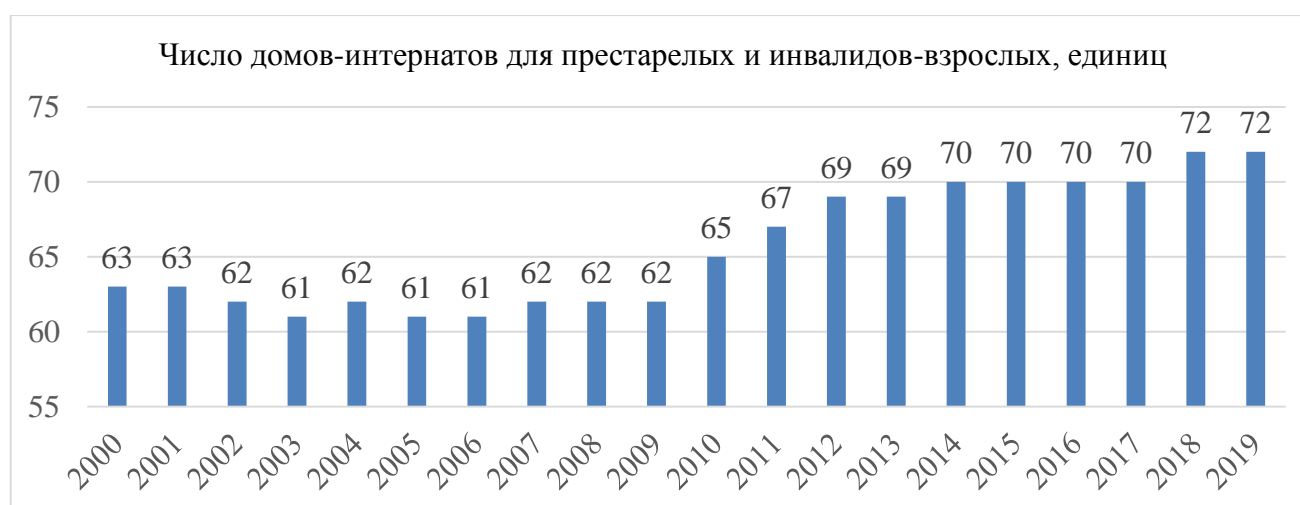
Рис. 2. Число домов-интернатов для престарелых и инвалидов-взрослых (единиц) [1]

Активная работа правительства Республики Беларусь по защите интересов престарелых и инвалидов-взрослых проявлялась еще и в том, что с 2010 г. в республике наблюдался рост числа домов-интернатов для данной категории граждан (рисунок 2).