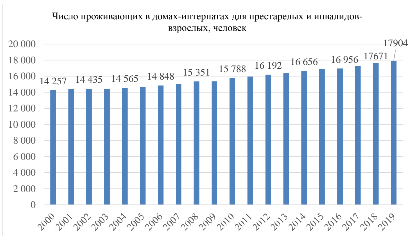
Рис.3. Число проживающих в домах-интернатах для престарелых и инвалидов-взрослых (человек) [1]

За анализируемый период рост числа проживающих в домах-интернатах для престарелых и инвалидов-взрослых составил 25,6%. Увеличение числа домов для инвалидов и престарелых, рост численности их жителей сопровождаются ростом среднего числа проживающих в них (рисунок 4).