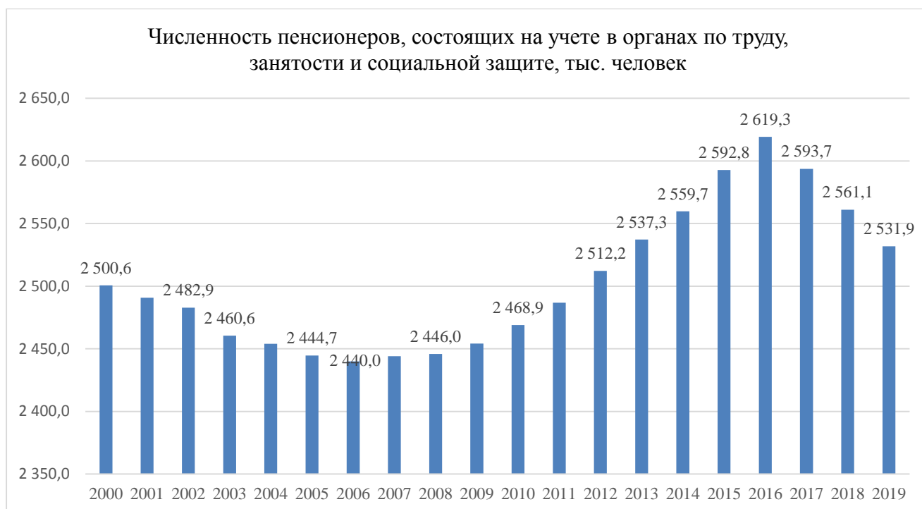
Рис.1. Численность пенсионеров, состоящих на учете в органах по труду, занятости и социальной защите (тысяч человек) [1]

Активная работа правительства Республики Беларусь по защите интересов престарелых и инвалидов-взрослых проявлялась еще и в том, что с 2010 г. в республике наблюдался рост числа домов-интернатов для данной категории граждан (рисунок 2).