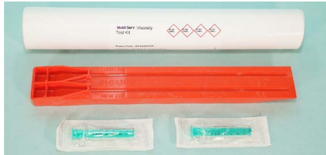
Рисунок 3 – Внешний вид экспресс-тестер вязкости Mobil Serv SM Flostick

кости работающего масла с вязкостью свежего. В настоящее время он широко используется для проверки любого масла от легких шпindelных до моторных и трансмиссионных.