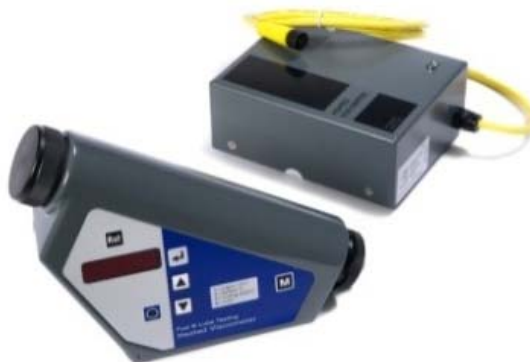
Рисунок 2 – Внешний вид вискозиметра Kittiwake

Вискозиметр Kittiwake [4] (рисунок 2) позволяет определять кинематическую вязкость (0–500 сСт) испытуемого масла при 40° С, 50° С или 100° С, значения которой автоматически выводятся на дисплей прибора.