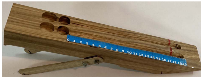
Рисунок 4 – Внешний вид компаратора вязкости

Несмотря на простоту использования приведенных выше экспресс-тестеров вязкости их приобретение в Республике Беларусь и странах СНГ не представляется возможным. В связи с этим, нами в БГАТУ разработан и изготовлен компаратор вязкости (рисунок 4), позволяющий произвести сравнение вязкости работающего и свежего масел по скоростям их течения по измерительным каналам.