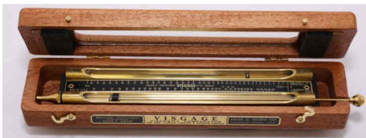
Рисунок 1 – Вискозиметр Visgage (США)

Для определения вязкости работающего моторного масла в мировой практике применяются различные экспресс-тестеры, позволяющие произвести сравнительную оценку изменения его вязкости по сравнению со свежим [3-5]. Так, известный прибор Visgage (рисунок 1) включает в себя две параллельные трубки, одна из которых заполняется свежим маслом, а другая – работающим [3]. В каждой трубке расположен стальной шарик. Устройство располагают под углом 25-30°, позволяя шарикам перемещаться сверху вниз. Когда первый шарик достигает дна, устройство возвращают в горизонтальное положение и фиксируют положение второго шарика. Значение вязкости работающего масла считывают по шкале, нанесенной непосредственно на приборе.