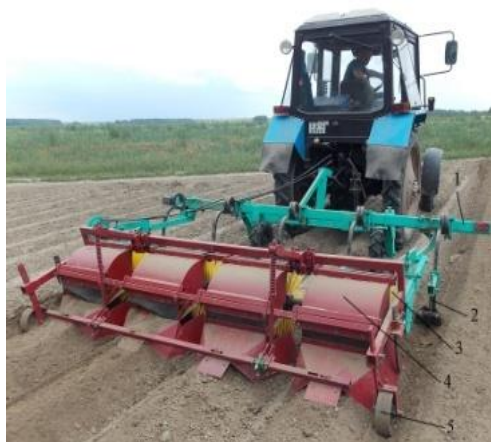
а) вид сбоку

В этой связи интерес представляет культиватор со щеточными барабанами, копирующими поверхность гребней, сформированных перед или при посадке культурных растений. Однако с целью обоснования конструктивно-режимных параметров рабочих органов необходимо провести дополнительные исследования. Культиватор состоит (рис. 1) из рамы с устройством для навески 1, рыхлительных и окучивающих лап на чизельных стойках 2, щеточных барабанов 3 и гребнеобразователя 3 с копирующими колесами 5.