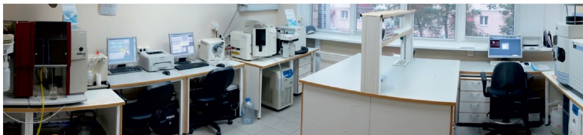
Рис. 7. Лаборатория токсикологических исследований РККИК Fig. 7. FCCC Toxicology Research Laboratory

Проводятся международные исследования совместно со специалистами Молдовы по изучению генов плесневых грибов, продуцирующих микотоксины, и оценке накопления микотоксинов в процессе хранения зерна и зерновых продуктов (рис. 7).