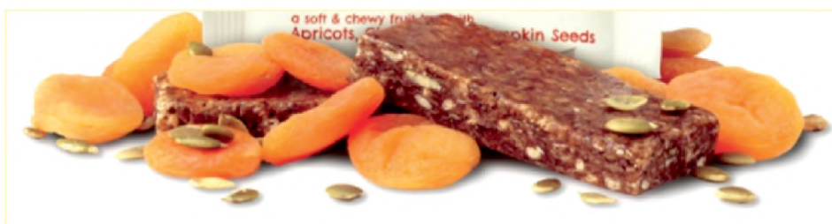
Рис. 5. Образец батончика-мюсли с повышенным содержанием пищевых волокон Fig. 5. Sample of cereal bar with a high content of dietary fiber

Внедрение новых видов изделий позволит расширить ассортимент пищевой продукции, позиционируемой как продукт «для перекуса», спрос на которую в настоящее время увеличивается.