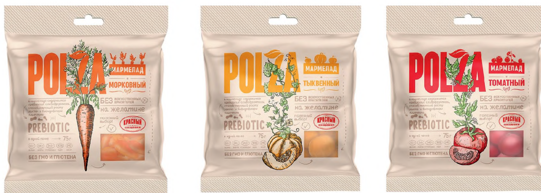
Рис. 6. Мармелад на желатине с добавлением овощных полуфабрикатов из отечественных видов сырья