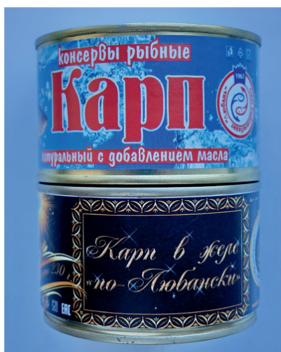
Рис. 4. Консервы из прудовой рыбы Fig. 4. Canned pond fish

В 2019 году специалисты кондитерской и масложировой отраслей разработали новые технологии производства батончиков-мюсли для диетического профилактического и диабетического питания, которые отличаются низким содержанием легкоусвояемых углеводов (расчетное содержание общего сахара 1,4 г в 100 г продукта) и сниженной на 10 % калорийностью; фруктовые батончики, в 100 г которых содержание пищевых волокон составляет более 5 г (рис. 5), что позволяет позиционировать данные изделия как «Пищевая продукция — источник пищевых волокон».