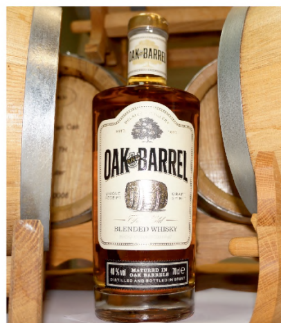
Рис. 1. Отечественный купажированный виски «Oak and Barrel» Fig. 1. Domestic blended whiskey “Oak and Barrel”

Созданы новые продукты для больных фенилкетонурией: клецки картофельные низкобелковые, пюре картофельное сухое низкобелковое, каша гречневая с изюмом низкобелковая, каша кукурузная с яблоком низкобелковая, крупа гречневая низкобелковая, крупа кукурузная низкобелковая, смесь сухая низкобелковая «Кекс «Ароматный», смесь сухая низкобелковая «Печенье «Аромат-