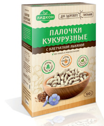
Рис. 3. Кукурузные палочки с клетчаткой льна Fig. 3. Flax fiber corn sticks