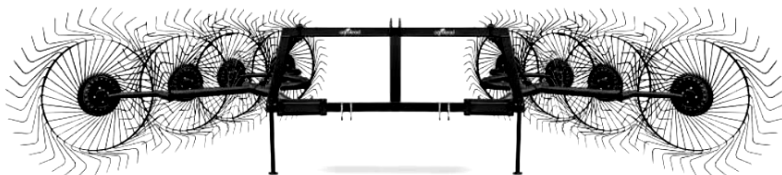
Рисунок 1 – Колесно-пальцевые грабли-валкователи

Наряду с такими машинами стали применяться и колесно-пальцевые грабли (рисунок 1).