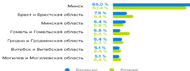
Рисунок 2. Доля вакансий по регионам, 2021

По количеству опубликованных вакансий и резюме в прошлом году лидирует Минск и Брестская область (рисунок 2).