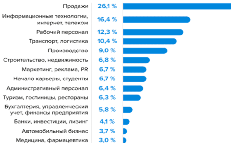
Рисунок 1. Структура вакансий, 2021 год (Представлены профобласти с долей вакансий более 3,0 %)

Первые строки в общей структуре вакансий на протяжении многих занимали вакансии для специалистов в сфере продаж, ИТ, предложения для представителей рабочих специальностей, а также в области транспорта и логистики. Прошлый год не стал исключением, и лидеры сохранили свои позиции (рисунок 2) [2].