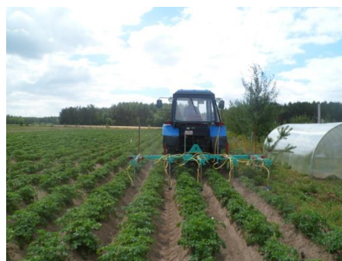
б) опрыскиватель в работе