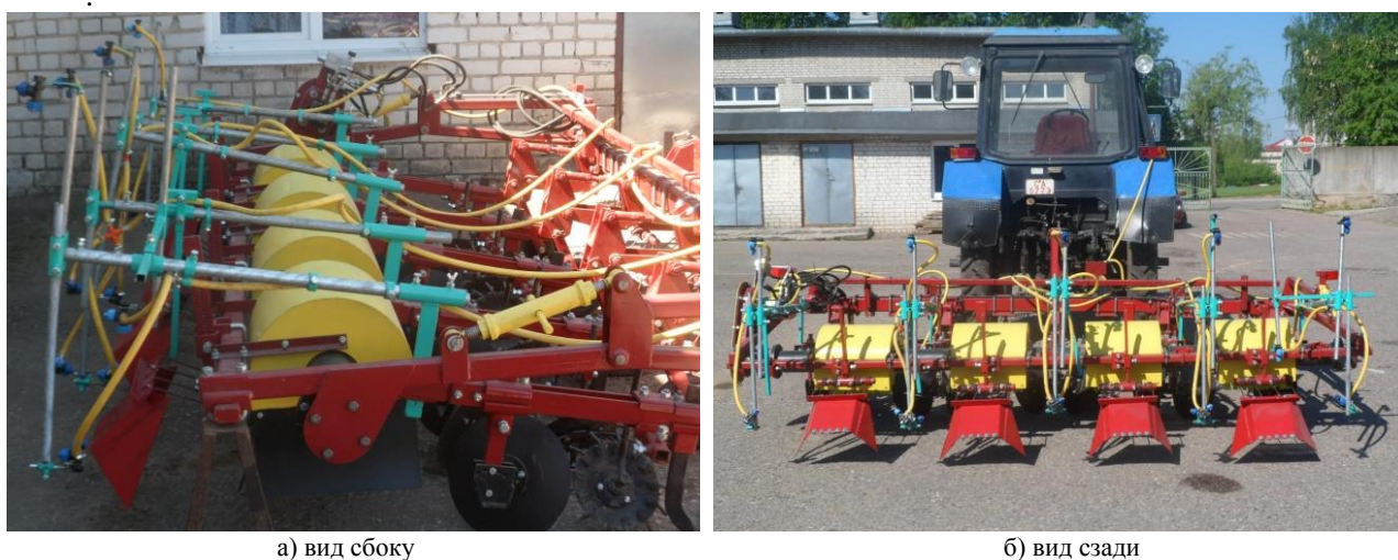
Рис. 2 Опрыскиватель телескопический комбинированный в составе агрегата для междурядной обработки АУ-М2

При обработке растений рабочими растворами ленточным способом на многовекторных узлах распыла 7 устанавливаются заглушки. Вертикальные стойки 6 с многовекторными узлами распыла 7, при этом поднимаются и фиксируются максимально вверх, а вертикальные стойки 11 с узлами распыла 12, направленными сверху вниз и расположенными на горизонтальных штоках 9 могут перемещаться вверх или вниз и фиксироваться в нужном положении, в зависимости от высоты ленточного внесения рабочих растворов. Ленточное внесение рабочих растворов может осуществляться перед посадкой картофеля при нарезке гребней, при довсходовой обработке или на верхнюю часть растений при послевсходовой обработке картофеля [16, 17, 18].