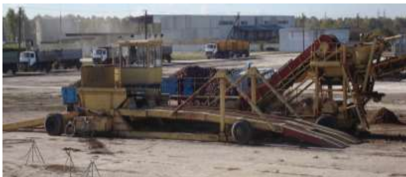
Рисунок 1 – Общий вид электрифицированной буртоукладочной машины

Материал и методика исследований. Буртоукладочная машина предназначена для укладки корнеплодов свеклы в крупногабаритные бурты (кагаты). В настоящее время на свеклоперерабатывающих предприятиях используются варианты с приводом от энергосредства в виде гусеничного трактора ДТ-75 или электрифицированные (более современный вариант) с приводом от электродвигателей. Сменная производительность таких машин находится в пределах 500-1500 т свеклы в сутки. Данные машины оснащены опрокидными площадками, обеспечивающими разгрузку бортовых автомобилей, автосамосвалов или автопоездов без расцепки, включая полуприцепы всех марок свекловичного транспорта (рисунок 1).