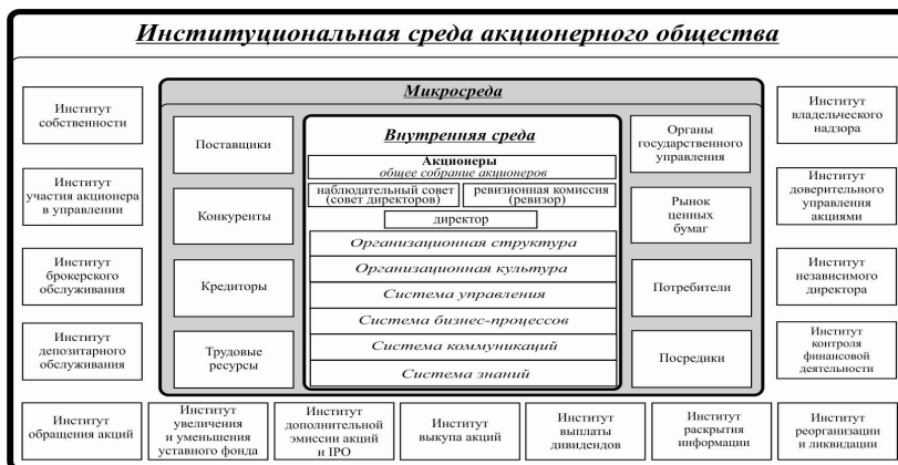
Рисунок 2. Институциональная модель акционерного общества

Институциональная модель акционерного общества предполагает наличие ряда характерных ей рыночных инструментов функционирования, которые делают ее более устойчивой и эффективной (рисунок 2).