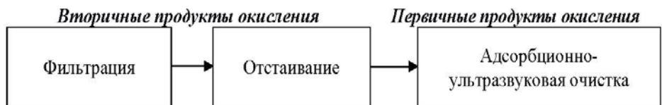
Рисунок 2. Схема очистки нерафинированного масла от первичных и вторичных продуктов окисления

Это позволит продлить действие антиоксидантных свойств жирных кислот и снизить интенсивность свободно-радикальной цепной реакции.