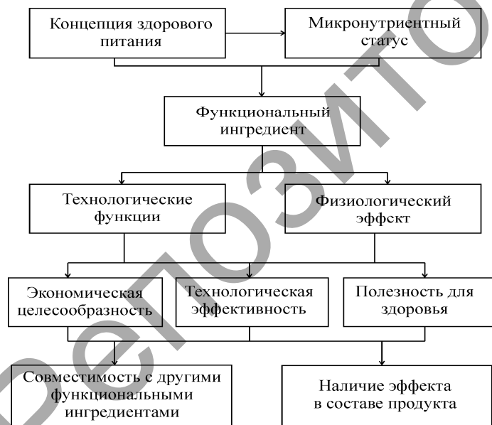
Рисунок 3. Главные аспекты выбора функционального ингредиента.

При подборе функционального ингредиента для создания продукции здорового питания учитывают различные аспекты (рис.3).