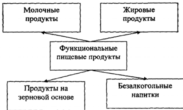
Рисунок 4. Основные группы функциональных продуктов.