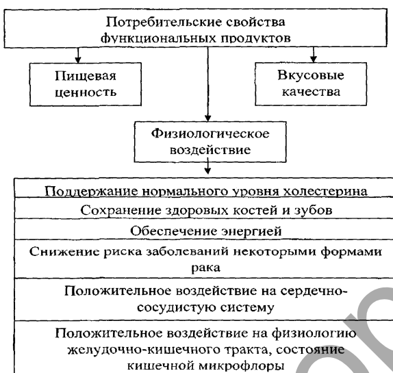
Рисунок 5. Потребительские свойства функциональных продуктов.

пробиотиков относятся бифидобактерии, т.к. ведущая роль в поддержании и нормализации микробиоценоза кишечника, повышении специфической резистентности организма, улучшении белкового и минерального обмена принадлежит именно этим микроорганизмам. При производстве бифидосодержащих молочных продуктов бифидобактерии культивируются совместно с молочнокислыми микроорганизмами. Ассортимент бифидопродуктов, вырабатываемых белорусскими молочными предприятиями, разнообразен. Это – бифидок, бифифрут, бифилайф, бифилак, бифилин, бифидобакт, бифитат и др.