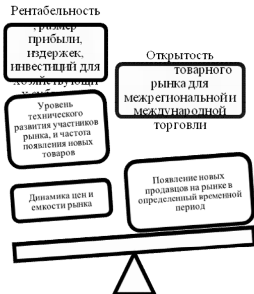
Рисунок 2. Параметры оценки результатов хозяйственной деятельности

К факторам, способствующим ограничению конкуренции на товарном рынке относятся: наличие барьеров для распространения информации о взаимозаменяемых (аналогичных) товарах и значительная доля вертикально-интегрированных хозяйствующих субъектов.