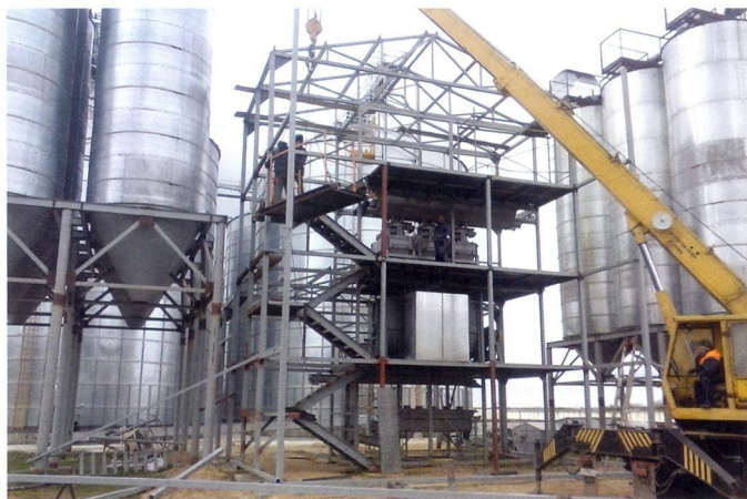
Рис. 2. Комплект комбикормового оборудования в процессе монтажа

к ней анкерными болтами (рис. 2). Специального фундамента не требуется. Снаружи контейнеры обшиваются сэндвич-панелями, и таким образом создается производственное помещение.