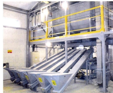
Рис. 1. Общий вид контейнеров с установленным технологическим оборудованием