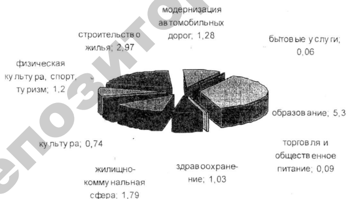
Рис.1. Направления финансирования социальной сферы села на 2005 – 2010 гг. (трлн. руб.)

В целях устойчивого развития сельских территорий, мотивации проживания в сельской местности предусматривается формирование качественно новых типов сельских поселков – агрогородков. Агрогородок – благоустроенный населенный пункт, в котором предусматривается создание производственной и социальной инфраструктуры для обеспечения социальных стандартов проживающему в нем населению и жителям прилегающих территорий. Они будут созданы на основе административных центров, сельсоветов, центральных усадеб сельскохозяйственных организаций, территории которых являются исторически устоявшимися административными образованиями. На развитие социальной сферы села направляется пятая часть средств из различных источников финансирования (рис.1).