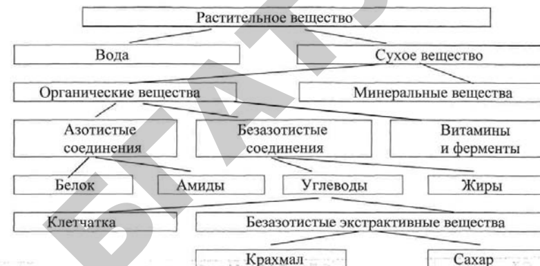
Схема 1.1 – Характеристика химического состава кормов

При организации нормированного кормления животных прежде всего надо знать потребность их в сухом веществе и содержание его в рационе. Количество сухого вещества определяют по разности массы образца до и после высушивания. Потребление сухого вещества корма связано с продуктивностью животных и зависит от многих факторов: разнообразия кормов в рационе, его структуры (типа кормления), концентрации энергии, качества кормов, их вкусовых и физических свойств, способа подготовки перед скармливанием, переваримости питательных веществ, уровня продуктивности животных и т. д.