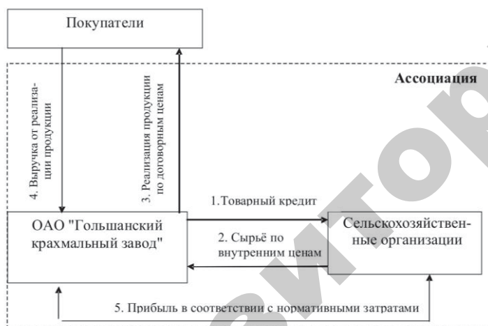
Рисунок 2. Схема формирования и распределения ресурсов в ассоциации

Составной частью механизма экономических отношений участников ассоциации выступают распределительные отношения, которые возникают по поводу обмена промежуточной продукцией и получения прибыли от реализации конечной продукции на внешнем по отношению к объединению рынке (рис. 2).