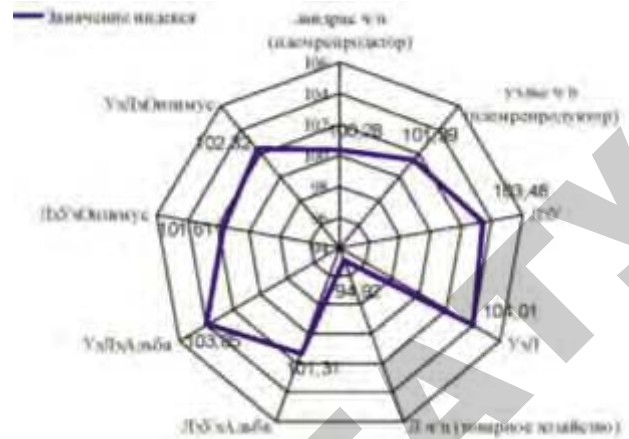
Рисунок 1. Значение индекса СИВЯС у маток разных генотипов

Наименьшими значениями индекса СИВЯС отмечались чистопородные матки породы Ландрас при чистопородном разведении в условиях товарного хозяйства. Наибольшие же значения этого индекса были отмечены у чистопородных маток Уэльской породы английской селекции при их сочетании с Ландрасами в условиях племенного репродуктора. Все двухпородные матки при их сочетании с терминальными хряками отмечались высокими значениями индекса СИВЯС по сравнению с чистопородными Ландрасами при их чистопородном разведении, как в условиях товарного хозяйства, так и в условиях племрепродуктора. Вместе с тем, сочетание двухпородных маток Ландрас х Уэльс с терминальными хряками Альба по значению индекса СИВЯС незначительно уступило чистопородным маткам породы Уэльс при чистопородном разведении в условиях племрепродуктора.