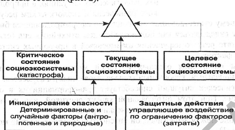
Рисунок 2 – Схема формирования понятия экологическая безопасность [4]

отклонения соответствующего параметра от его целевого экологически безопасного значения и приемлемой вероятностью события (рис. 2).