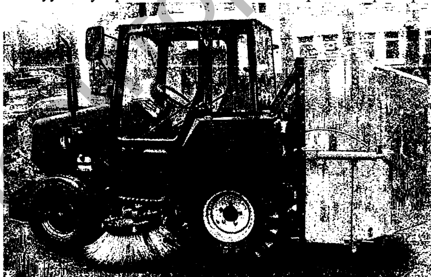
Рисунок 3 - Вакуумно-уборочная машина ВПМ-2 на базе трактора МТЗ-320