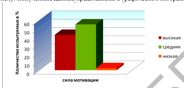
Рисунок 1. - Показатели мотивации достижения успеха у студентов.

Анализ материалов исследования показал, что, в целом, студентам свойственен высокий и средний уровни мотивации к успеху. Полученные данные представлены в графическом изображении (рис. 1.).