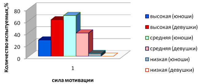
Рисунок 2. - Показатели мотивации достижения успеха у студентов – юношей и девушек