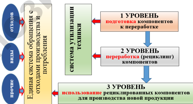
Рисунок 4 – Уровни воздействия на компоненты ВЭТ

3 уровень – использование переработанных компонентов.