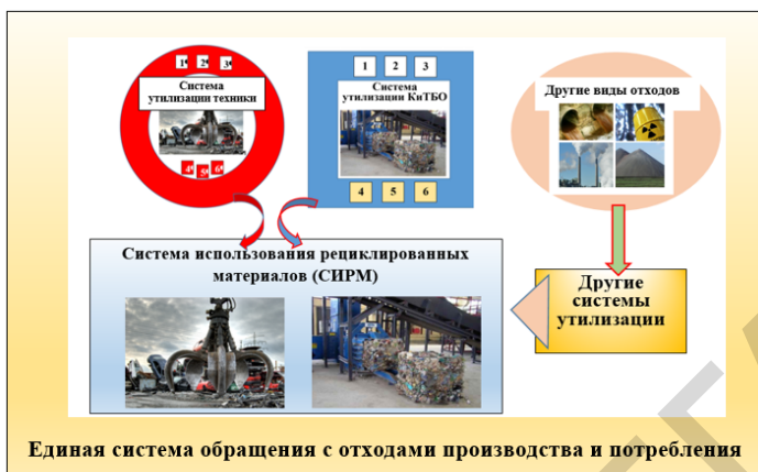
Рисунок 3 – Структура Единой системы обращения с отходами производства и потребления (ЕСОО): 1-6 – этапы проведения работ

Система утилизации КиТБО направлена на переработку непредсказуемого конгломерата отходов, которые обычно делятся на коммунальные отходы и твёрдые бытовые отходы и чаще всего поступают на площадки сбора одновременно и перерабатываются по единой технологии.