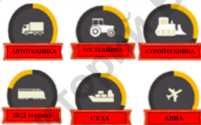
Рисунок 5 – Некоторые виды техники, которую необходимо утилизировать

Система утилизации ВЭТ должна включать в себя не только утилизацию техники различных видов (рисунок 5), но и обеспечивать захоронение отходов утилизации, не пригодных для дальнейшего использования [1].