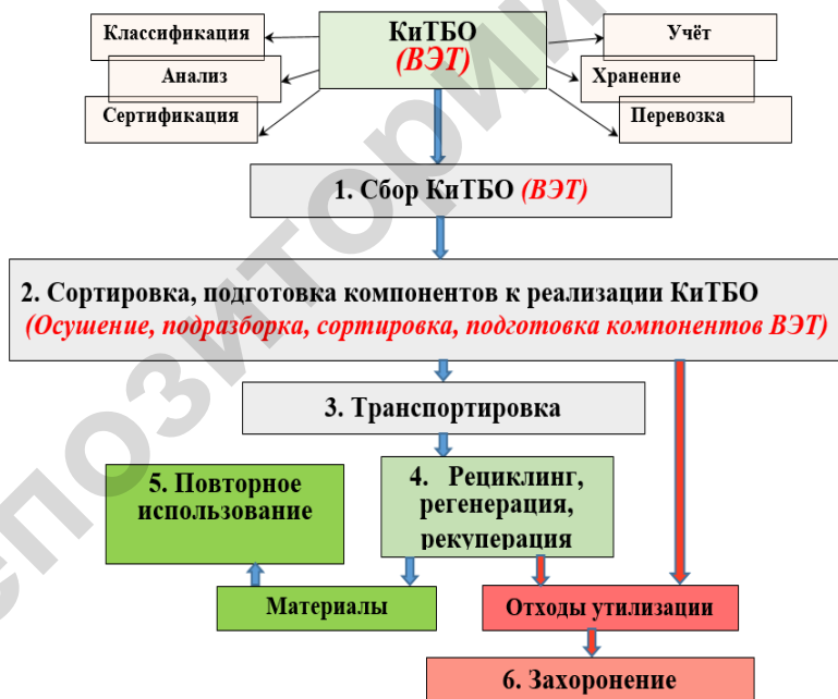
Рисунок 2 – Общая схема обращения с отходами производства и потребления применительно к ВЭТ и КиТБО

Как видно из рисунка, общая структура выполняемых работ по утилизации КиТБО мало чем отличается от работ по утилизации ВЭТ.