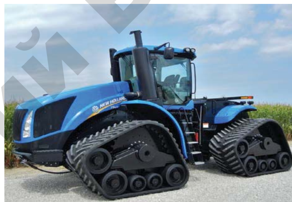
Рисунок 4. Трактор «New Holland» серии Т9

Таким образом, потенциально трактор с колесной формулой 4x4б может развить большую силу тяги, чем трактор с колесной формулой 4x4а. Однако, как правило, тракторы 4x4б тяжелее, недостаточно устойчивы на склонах, имеют худшую технологическую обзорность, менее приспособлены к работе с комбинированными агрегатами. Для снижения давления на почву, колесные тракторы по схеме 4x4б технологичнее для создания четырехгусеничных моделей (рис. 4).