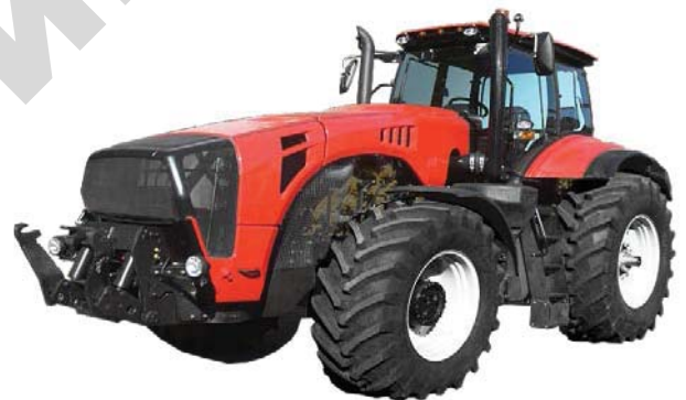
Рисунок 2. Трактор «БЕЛАРУС – 4522»

Мощность двигателей тракторов «Фендт» достигает