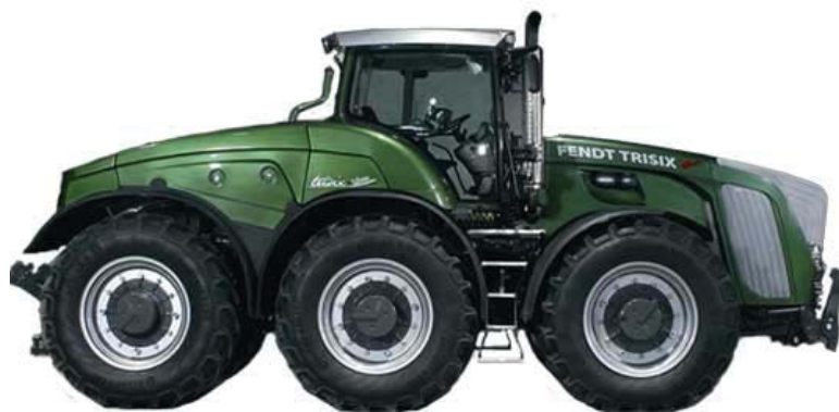
Рисунок 5. Трактор трехосный «Fendt Trisix Vario»

Рассмотренные модели выполняются с шарнирно-сочлененной рамой. По сравнению с базовыми моделями заметно возрастает вес тракторов. Так, если трактор К-701 имеет эксплуатационную массу 13,5 т, то трактор КТ5703 ТТБ-5-1 – массу 21,1 т. Мощные тракторы «Фендт» серии 1000 имеют эксплуатационную массу – 14 т, а трехосный вариант с двигателем 500 л. с. – 19 т. Все трехосные тракторы выполняют с колесной формулой 6х6.