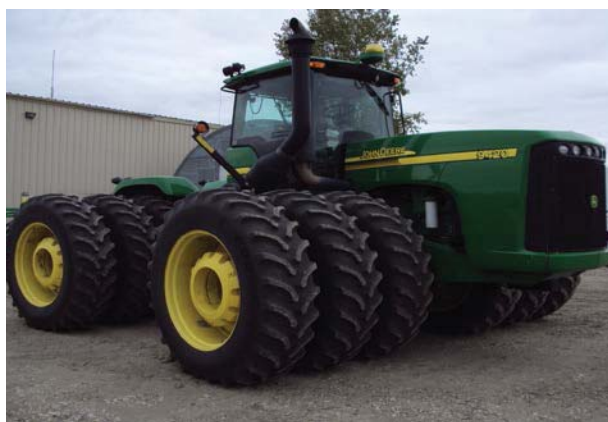
Рисунок 3. Трактор John Deere 9420

Как показано выше, широко распространенным способом улучшения проходимости тракторов является сдвигание или страивание колес. Это дает положительный эффект для повышения тягово-сцепных свойств из-за увеличения сцепного веса трактора, снижения давления на почву, уменьшения колееобразования. Однако маневренность и технологические возможности тракторов снижаются из-за возрастания ширины трактора, ограничения скорости движения. Так, для тракторов «БЕЛАРУС» максимальная скорость при сдвоенных передних колесах не должна превышать 10 км/ч. Сдвигание колес приводит к увеличению уровня воздействия на подпахотные слои почвы [2]. Это можно объяснить ростом опорной площади из-за увеличения количества шин и наличия расстояния между сдвигаемыми колесами. Кроме того, эффективность от сдвигания колес уменьшается из-за ограничения производителями допустимого снижения давления воздуха в шинах. Так, например, для рассматриваемых тракторов «БЕЛАРУС» в шинах задних колес в большинстве случаев это снижение не превышает 0,01...0,03 МПа, а значение давления не должно быть ниже 0,08...0,09 МПа. При более низких давлениях воздуха в шинах возможен проворот шин на ободьях, разрушение отдельных элемен-