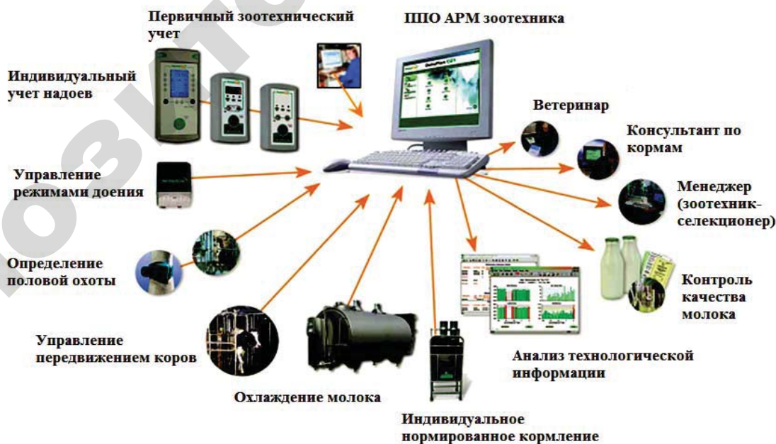
Рисунок 1. Структура системы управления стадом КРС

В состав систем управления стадом могут также входить и другие компоненты: система регистрации живой массы коров, система задания рационов кормления, система анализа походки животных (рис. 1). В соответствии с фундаментальным принципом поэтапного развития АСУ состав систем расширяется по мере создания новых технологических подсистем [2]. Примером являются системы оптического слежения за продолжительностью отдыха животных, контроля жевательной активности, отправки информации по окончании каждой смены на мобильный телефон. Кроме того, технически осуществимо объединение систем управления стадом и системы складского учета и контроля качества приготовления и раздачи кормов в интегрированную АСУ с единым банком данных, основу которого составляют сведения зоотехни-