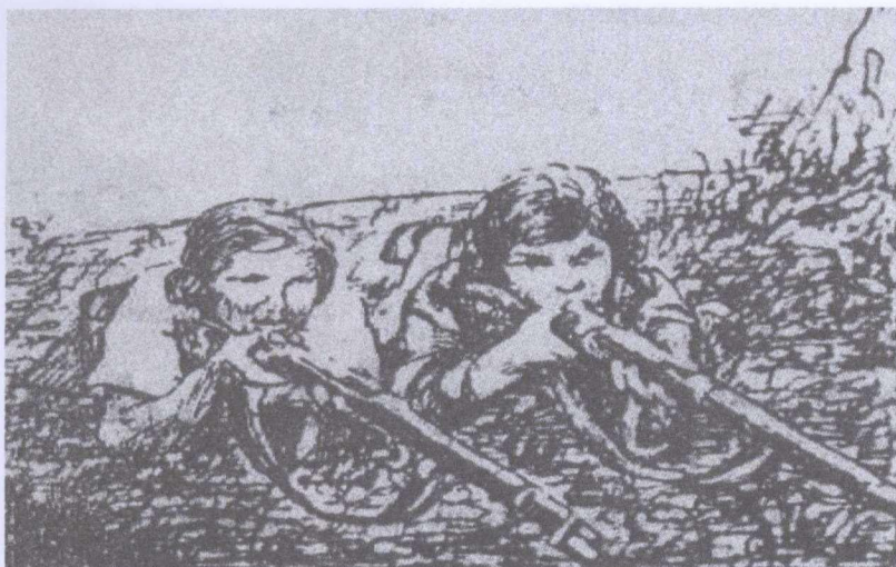
Рисунок из газеты «Чырвоная змена» за 19 июля 1927 года