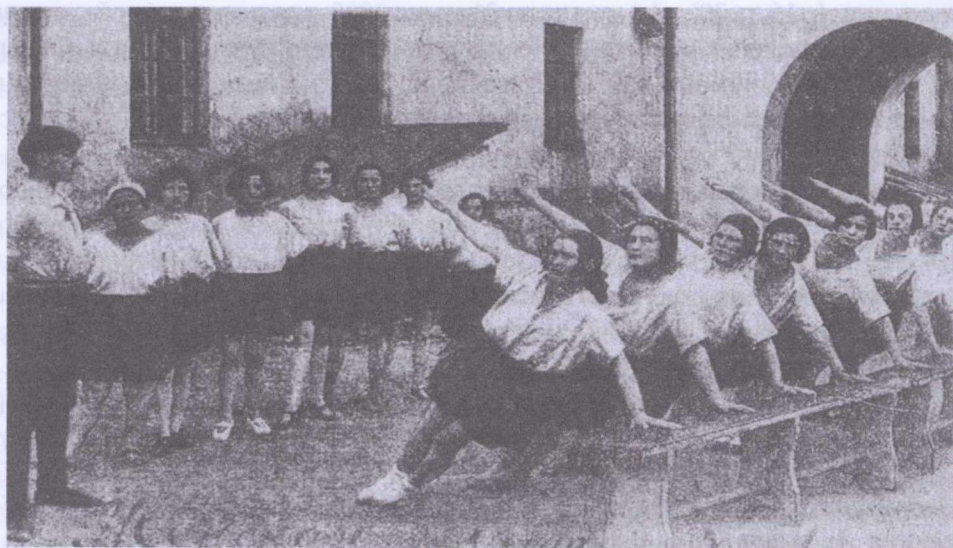
Студентки одного из техникумов Минска на физкультурных занятиях. 1926 год