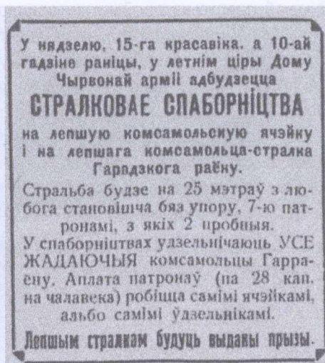
Объявление из газеты «Чырвоная змена» за 11 апреля 1928 года

Летом 1928 года отправлялся в военные лагеря очередной второй курс. Слушатели третьего и четвертого курсов совершали трехнедельные выходы в поле. Количество студентов в таких группах составляло 65–69 человек. Подготовительные работы осуществлялись за два-три месяца. По итогам обучения сдавались экзамены, которые принимала государственная комиссия, включавшая представителей заинтересованных организаций. По отзывам войсковых частей, военкомата выпускники института получали хорошие основы военных компетенций, по итогам обучения ставились на учет окружным военкоматом младшими командирами запаса [5, С. 50–53].