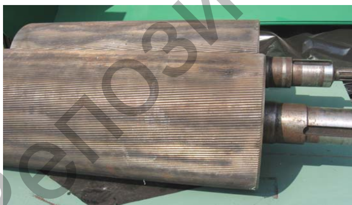
Рисунок 96 – Комплект вальцов с винтовой нарезкой рифлей

Бункер предназначен для приема зерна, решетка – для задержания кусковых включений, магнитный сепаратор – для задержания ферромагнитных примесей.