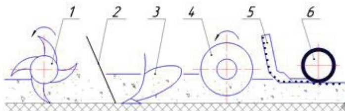
1 – почвообрабатывающее орудие; 2 – дека-гребнеобразователь; 3 – гребнеобразователь; 4 - профилирующие барабаны; 5 – сеялка; 6 – прикатывающие колеса Рисунок 1 – Схема технологическая посева овощных культур

Подготовка почвы является самым энергоемким, дорогостоящим и ответственным этапом в растениеводстве. От качества и своевременности проведения предпосевной обработки при посеве овощных культур напрямую зависит урожайность и экономическая эффективность их возделывания.