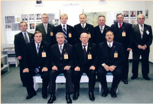
Делегаты первого съезда ученых Республики Беларусь от БГАТУ.

В научных трудах В.Н. Дашкова уделено большое внимание определению направлений совершенствования средств механизации сельского хозяйства, обоснованию технической политики в отрасли. Под руководством и при непосредственном участии В.Н. Дашкова разработаны сельскохозяйственные машины нового поколения, в числе которых оборотные плуги, комбинированные почвообрабатывающие агрегаты АПП-3 и АПП-4,5; сеялка С-6Т; машины для внесения минеральных удобрений МТТ-4Ш; МТТ-4У; АПЖ-12; установки для искусственного орошения посевов УДМ-2500; оборудование для механизации свиноводческих и молочнотоварных ферм, доильные установки, охладители молока, зерносушилки и другая техника. Все они внедрены в сельскохозяйственное производство.