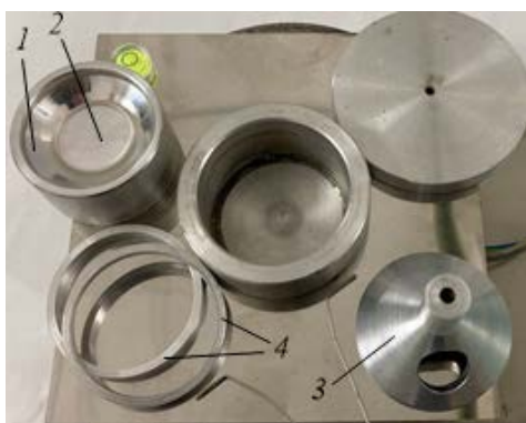
Рисунок 2 – Внешний вид универсального электротигля с набором приспособлений

Экспресс-метод определения pH (повышение кислотности) ММ основан на методе К. Дж. Мастерса [5] с применением кислотно-основного индикатора (индикаторная бумага pHSCAN 4,0–7,0 с шагом 0,2).