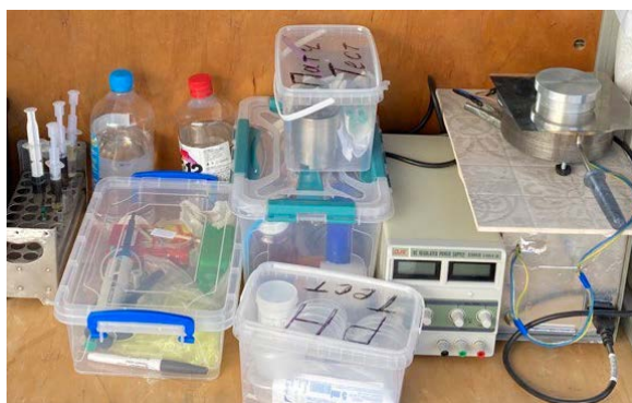
Рисунок 1 – Внешний вид мини-лаборатории для контроля свойств ММ

В БГАТУ в рамках выполнения НИР «Разработка экспресс-методов контроля свойств моторного масла для оценки технического состояния и работоспособности тракторных двигателей в процессе их эксплуатации» ГПНИ «Сельскохозяйственные технологии и продовольственная безопасность» создана мини-лаборатория экспресс-тестирования [1] (рисунок 1), позволяющая определять основные показатели качества моторного масла (ММ): плотность, вязкость, содержание топлива и воды, моюще-диспергирующие свойства, водородный показатель pH , количество сажи и механических примесей.