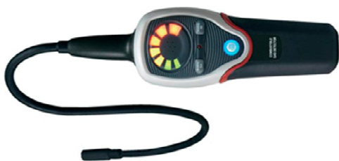
Рисунок 2 – Электронный течеискатель

Электронные течеискатели измеряют изменение электрического тока в воздушном промежутке между двумя платиновыми электродами, расположенными на конце прибора. Когда хладагент проходит через промежуток, он ионизирует воздух между электродами и изменяет ток. Когда хладагент присутствует, ток между электродами увеличивается, так как воздух становится более благоприятным для прохождения тока. Чувствительный сигнал дает специалисту знать о присутствии хладагента и его количестве, увеличивая частоту звуковых и визуальных сигналов [2].