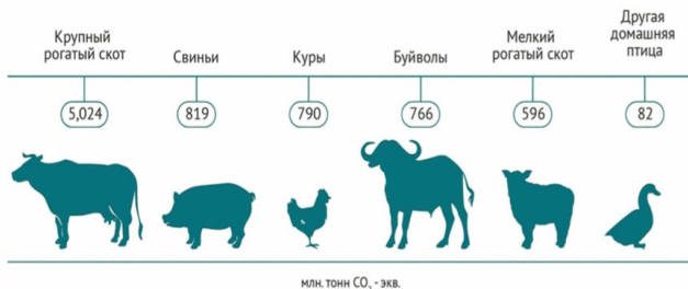
Рисунок 2 – Глобальные выбросы по видам домашних животных и птицы

Около 50 % выбросов метана происходят из антропогенных источников, которые включают сельскохозяйственную деятельность. Общая глобальная оценка антропогенных выбросов приближается к 320 млн тонн в год [3]. При этом основными источниками эмиссии парниковых газов на этапе выращивания животных являются выбросы метана из их пищеварительного тракта, а также закиси азота из навоза [4].