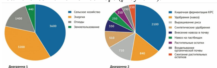
Рисунок 1 – Годовые глобальные антропогенные выбросы метана (CH 4 )

Производственная деятельность, связанная с содержанием жвачных животных, предполагает необходимость решения проблемы сокращения выбросов парниковых газов при одновременном увеличении производства мяса и молока для удовлетворения потребительского спроса. На диаграмме 1 указаны основные источники выброса метана, на диаграмме 2 приведены выбросы метана в сельскохозяйственном секторе (рисунок 1).