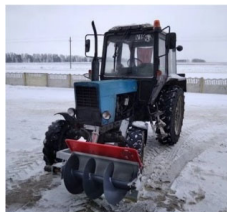
Рисунок 3 – Общий вид шнековый подталкиватель кормов производства фирмы ООО «Юликом Плюс» (Республика Беларусь)