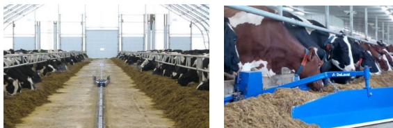
Рисунок 6 –Процесс работы стационарных подгребателей кормов

Данные подгребатели могут устанавливаться как в центре кормового стола, так и вдоль ограждений. Установка вдоль ограждений позволяет обеспечить более качественное формирование бурта. Форма применяемых отвалов позволяет обеспечить перемещение корма в вертикальной и горизонтальной плоскости.