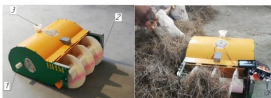
Рисунок 5 – Общий вид робота-подталкивателя; 1 – выход дозатора кормовых добавок; 2 – шнек-толкатель; 3 – наполнитель с доводчиком

Применение роботов на ферме позволяет снизить нагрузку на персонал. Кроме этого, благодаря электроприводу робот в работе более экологичен и не создает шума. Недостатком представленных роботов является подпрессовывание кормов в процессе работы. Российскими исследователями предложена конструкция робота-подталкивателя со шнековым рабочим органом и дозатором для периодического внесения энергоемких комбикормов (рисунок 5) [3]. Внесение комбикормов в процессе подгребания позволяет повысить привлекательность кормовой смеси для животных.