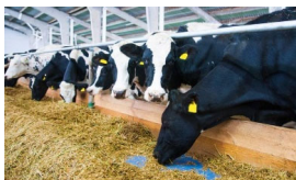
Рисунок 1 – Общий вид кормового стола

мах процесс погребения осуществляется несколькими способами: вручную или с применение специализированных машин – подталкивателей кормов.