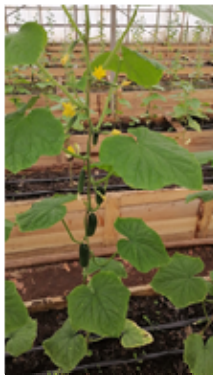
Рисунок 1 – Гибрид огурца F1 Монолит

Теплицы расположены в Лежневском районе Ивановской области, третья световая зона. Теплица 2019 года постройки, собрана из металлических ферм, покрытых поликарбонатом 6 мм. Размеры теплицы: ширина 20 метров, длина 70 метров, высота в коньке 4,5 метра, высота боковых стоек 2 метра, полезная площадь 1200 м 2 .