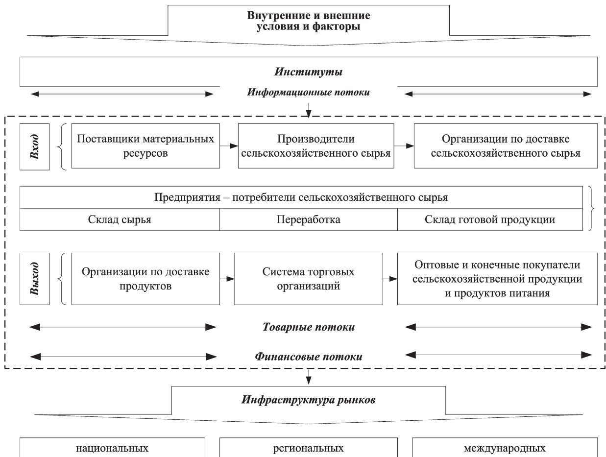
Рис. 1. Общая модель глобальной ПСЦ в сфере продовольствия и сельского хозяйства

Ключевые элементы глобальной ПСЦ структурированы в формате двух технологически дифференцированных процессов: (1) вход, который представлен поставщиками материальных ресурсов, производителями сельскохозяйственного сырья, организациями по доставке сельскохозяйственного сырья, предприятиями – потребителями сельскохозяйственного сырья; (2) выход включает организации по достав-