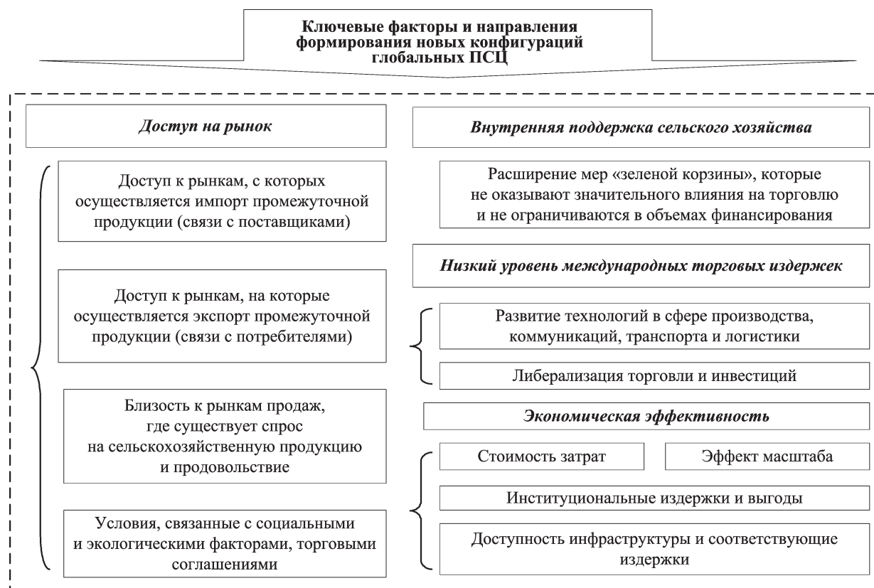
Рис. 3. Ключевые факторы и направления формирования новых конфигураций глобальных ПСЦ в сельском хозяйстве и пищевой промышленности