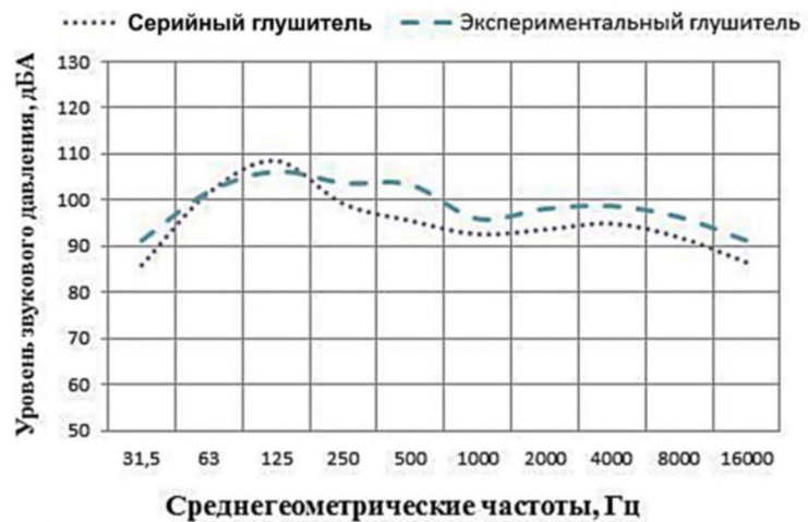
Рисунок 3. Уровень звукового давления на срезе глушителей на режиме максимальных оборотов двигателя