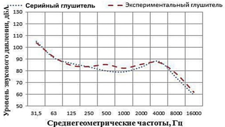
Рисунок 2. Уровень звукового давления на срезе глушителей на режиме холостых оборотов двигателя