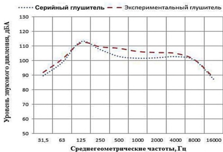
Рисунок 4. Уровень звукового давления на срезе глушителей на режиме эксплуатационной мощности двигателя