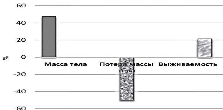
Рисунок 3. Отклонения рыбоводных показателей зимовки годовиков между двумя линиями селекционного зеркального карпа пятого поколения (%)

Масса тела годовиков второй линии была значительно выше, чем в первой линии (36,6 г против 24,8 г). Величина отклонения средней массы тела первой линии от второй составила 11,8 г или 47,6 % (рис. 3). Годовики первой линии похудели за зимний период несколько меньше, чем второй, отклонение составило 2,6 или 50,0 %. Годовики первой линии характеризовались повышенной выживаемостью по сравнению с первой линией, отклонение составило 13,2 или 21,7 %.