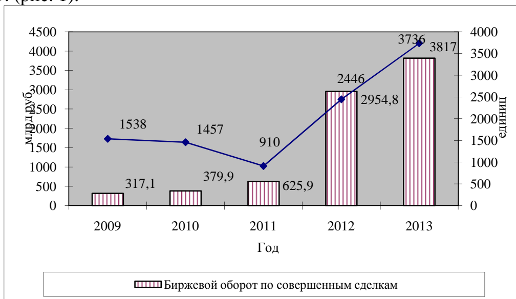
Рис. 1. Динамика объемов и количества биржевых сделок по секции сельскохозяйственной продукции ОАО «Белорусская универсальная товарная биржа» за 2009-2013 гг.

В 2013 г. по секции сельхозпродукции совершено 3736 сделок на сумму 3817,0 млрд руб., или на 477 млн USD, что на 28,9 % больше, чем в 2012 г. (рис. 1).