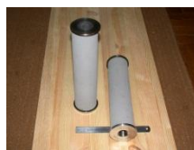
Рис. 3 - Фильтрующий элемент для стерилизации воздуха