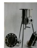
Рис. 4 - Фильтр для очистки воды

Опыт эксплуатации разработанных ПФМ подтверждает возможность эффективного использования этих материалов на предприятиях АПК.