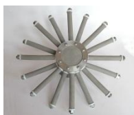
Рис. 2 - Диспергатор для системы обеззараживания воды

Фильтрующие материалы на основе порошков титана хорошо показали себя, в процессах тонкой очистки воды, стерилизации и бактериальной очистки воздуха, обеззараживания воды, очистки пара на производствах по выпуску кормовых добавок и ферментных препаратов для производства этилового спирта, в установках замкнутого водоснабжения при выращивании рыбы. На рисунках 2-4 приведены примеры разработанных изделий.